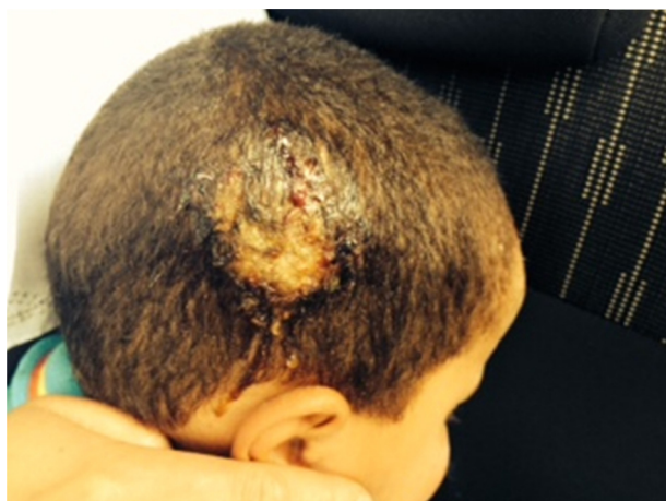
Figure 2 Aspect clinique d'un kérion de Celse à Trichophyton mentagrophytes . Clinical aspect of Celse kerea to Trichophyton mentagrophytes .

cette pathologie est encore fréquente en Tunisie et au Maroc [30,31].