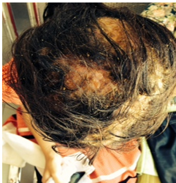
Figure 1 Aspect d'une teigne ectoendothrix chez une enfant de 8 ans. Ectoendothrix capitis tinea in 8 years old child.

Nos données sont semblables à celles d'autres pays d'Afrique du Nord, y compris la Tunisie et le Maroc, où M. canis et T. violaceum sont les agents les plus fréquents des teignes [30,31]. Bien que le favus (causé par Trichophyton schoenleinii ) soit rarement diagnostiqué en Algérie [32],